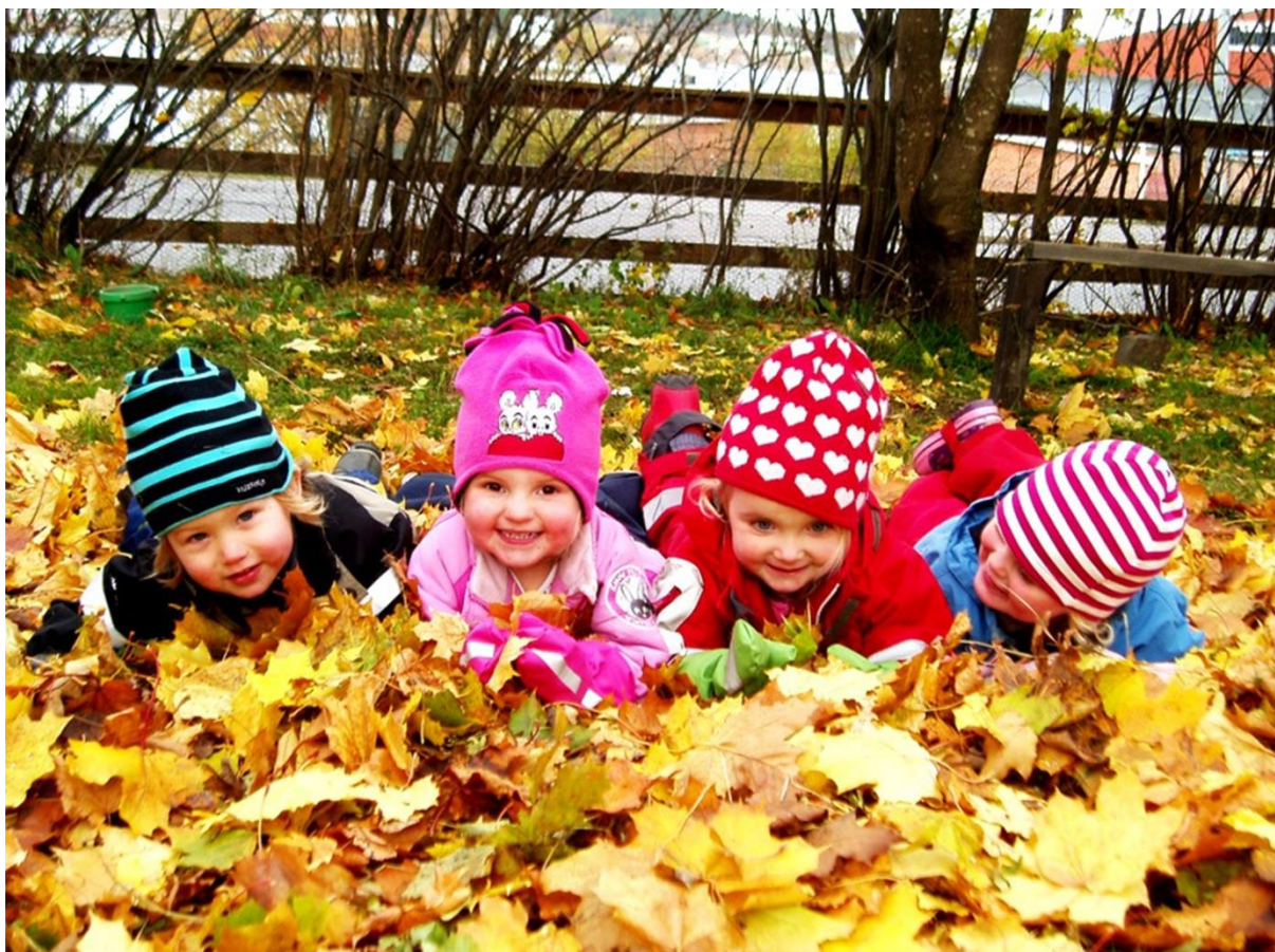
Tuvans förskola, Härnösand